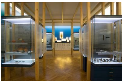
Dio stalnog postava – Arheološki odjel