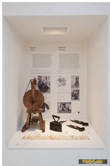
Građa u Memorijalnom centru Lipa pamti

Dokumentima, fotografijama i građom, predstaviti će se načini izrade izvornih kastavskih poslastica. Organizirat će se i radionice vezane uz temu.