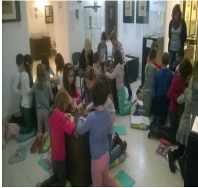
Radionica u Kastvu