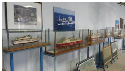
Makete brodova u Kraljevici