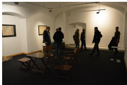
Izložba Sjećanje na more