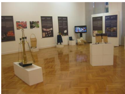
Izložba Tržnica - trbuh grada u Narodnom muzeju Vojvodine

Izložba donosi paralelnu kronologiju zbivanja u gradu Rijeci, Hrvatskoj, Svijetu i u prostoru Guvernerove palače. Kronologije su aplicirane na piramidalnim konstrukcijama koje su postavljene u središtu palače tj. Velikog atrija.