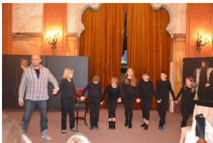
Dramci iz Guvera