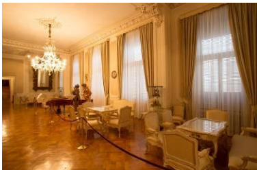
Dio stalnog postava – Kulturnopovijesni odjel