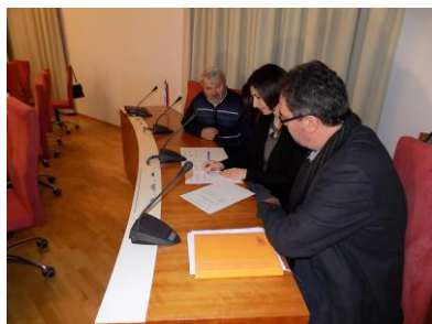
Potpisivanje sporazuma o suradnji na Akademiji pomorskih zanata i vještina u sklopu projekta Mala barka 2