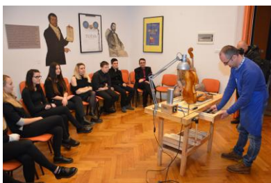
Radionica Kako nastaje violina