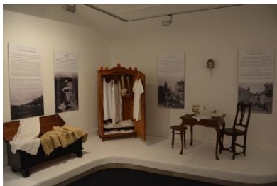
Postav izložbe "Snovi u bijelom"