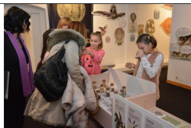
Interaktivni dio Bertuchova slikovnog carstva”