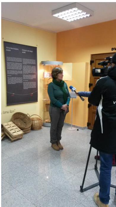
Izjava za HTV povodom otvorenja izložbe "Tržnica - trbuh grada"

Tamara Mataija održala je 2 vodstva kroz stalni postav na talijanskom jeziku za učenike, 1 vodstvo kroz postav Kresnik za profesore glazbenih škola iz Slovenije.