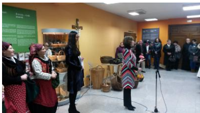
Otvorenje izložbe "Tržnica trbuh grada" u Županji

Arheološki odjel (Ranko Starac) realizirao je u sklopu projekta CROMART novu etapu arheoloških iskopavanja groblja kod crkve Svetog Petra u Supetarskoj Dragi.