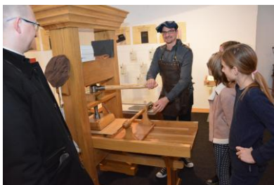
Interaktivni dio izložbe "Riječ(a)nima"

reprezentativne salone nekadašnje Guvernerove palače na prvome katu u jednom dijelu obogaćene radovima učenika Škole za primijenjenu umjetnost u Rijeci nastalima u sklopu edukativnih radionica održanih u sklopu obilježavanja 120. obljetnice izgradnje Guvernerove palače, Memorijalnu zbirku Dr. Franjo Kresnik – Između umijeća i umjetnosti, a na drugome katu stalni postav Zavičajni memento: Tragovi vremena i Od narodnih vladara do Marije Terezije, postav U obrani domovine te Lapidarij u dvorištu muzeja.