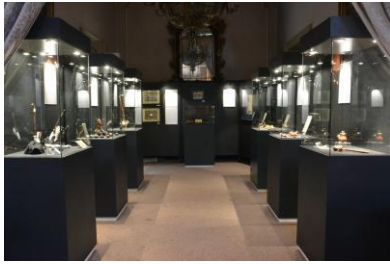
“Lule iz fundusa muzeja”