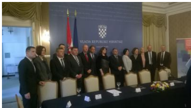
Potpisivanje sporazuma za projekt "Integrirani projekt revitalizacije Guvernerove palače i Nugentove kuće u Rijeci"

Pokrenuta je web trgovina na web sjedištu muzeja (Tihomir Tutek). Web sjedište Muzeja posjećeno je 14740 puta , a kreirano je 63 objava i 14 novih stranica . (Tihomir Tutek)