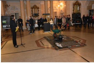
Otvorenje izložbe u sklopu projekta Claustra +