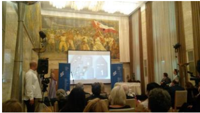
Predstavljanje Memorijalnog centra Lipa pamti na formu "Živa" na Bledu

održavanja edukativnih radionica u Čudotvornici 10.000,00 kn, za izdavanje edukativne publikacije 10.000,00 kn, za restauraciju muzejske građe 20.000,00 kn, za arheološko istraživanje na lokalitetu Grobnik-Grobišće 24.000,00 kn, za službena putovanja na simpozij u Sloveniji te 23. Forum AMMM u Italiji ukupno 1.944,00 kn.