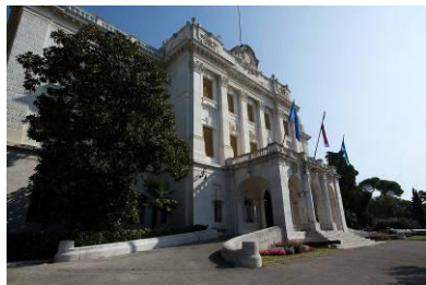
Guvernerova palača – sjedište Muzeja

POMORSKI I POVJESNI MUZEJ HRVATSKOG PRIMORJA RIJEKA