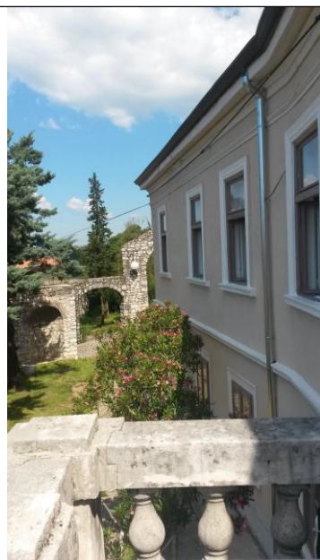
Pogled s balkona Nugentove kuće

- za EU projekt CLAUSTRA+ ostvareno je 80.282,00 kn što čini 99,11% od planiranih 81.000,00 kn.