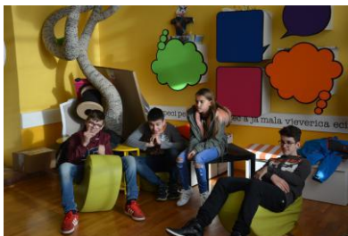
Radionica u Čudotvornici