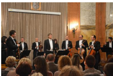
Nastup Zgrebačkih solista u sklopu "Lisinski u Rijeci"