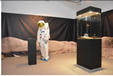
Postav izložbe "Povratak na Mjesec"

centra povijesti pomorstva otoka Krka u gradu Krku.