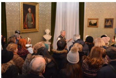
Vodstvo kroz stalni postav