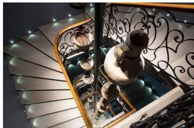
Dio stalnog postava - Arheologija

Pomorski i povijesni muzej Hrvatskog primorja Rijeka, osnovan je 1893. godine kao Museo Civico . Od 1961. godine nosi današnji naziv. Svoju djelatnost obavlja osnovom Zakona o muzejima (NN 110/15) i Zakona o zaštiti kulturnih dobara (NN 69/99, 151/03, 157/03, 87/09 I 88/10).