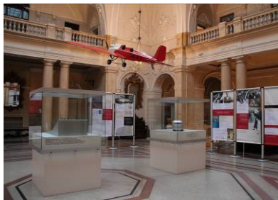
Leteći čovjek – Stanko Bloudek