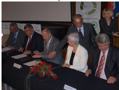
Potpisivanje sporazuma o financiranju Centralne zone za gospodarenje otpadom Marišćina