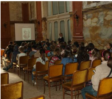
Predavanje u Muzeju

Igračka z Bele nedeji U organizaciji Udruge 'Kastav' održan je plesni večer u Opatku. Na plesu su nastupili članovi Udruge 'Kastav' i gostujući plesači. Večer je bila vrlo zanimljiva i atraktivna. U organizaciji Udruge 'Kastav' održan je plesni večer u Opatku. Na plesu su nastupili članovi Udruge 'Kastav' i gostujući plesači. Večer je bila vrlo zanimljiva i atraktivna.