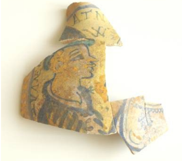
Arheološki radovi na stambenom dijelu Trsatske gradine