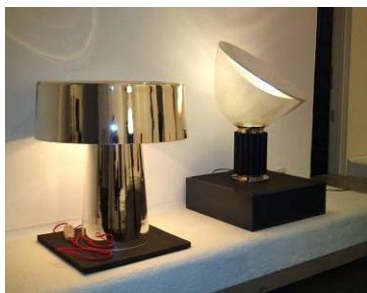
I bi svjetlo