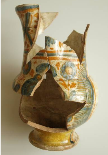
Terenski nalazi iz Starog Grada