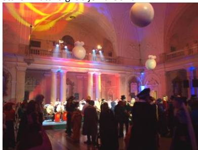
Humanitarni rotarijanski bal 2011.