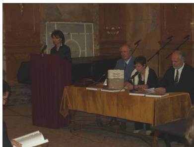
Promocija monografije Stranče – Vinodol, starohrvatsko groblje na Gorici