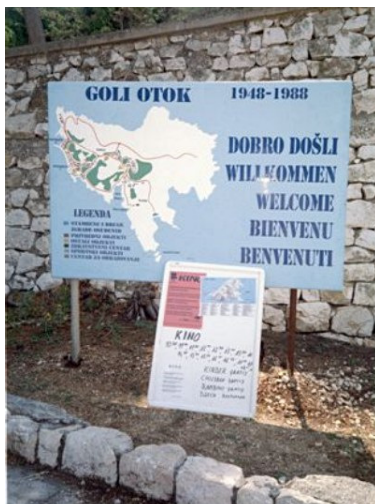
Terenski obilazak Golog otoka radi izrade elaborata o spomeničkoj valorizaciji