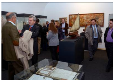
Pomorstvo Boke Kotorske za vrijeme venecijanske uprave

Kroz tekuće održavanje zgrade izvršeno je ličenje zidova i stolarije malog atrija, hodnika, stepeništa i izložbenog prostora, sanacija limenog kosog krova, čišćenje i silikoniranje spojeva na staklarniku, popravak vodovodne instalacije u dvorištu, servisiranje instalacija kotlovnice, popravak roletni u Žutom salonu, izrada žičane ograde i vrata iza zgrade, izrađene su maske radijatora te je izvršeno brušenje i kristalizacija terrazzo poda na balkonu i hodniku.