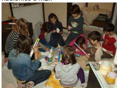
Radionice u MZK