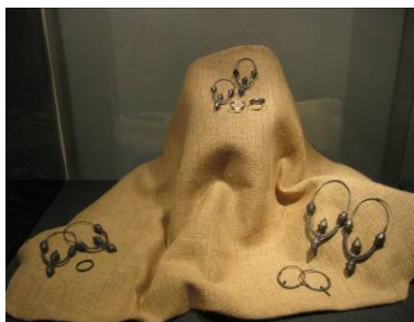
Stranče – Vinodol, starohrvatsko groblje na Gorici