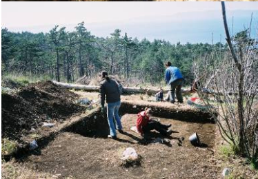
Arheološki teren na Solinu