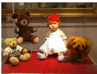
Igre i igračke