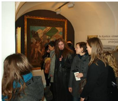
U Noći muzeja 2011. muzej je posjetilo 5100 posjetitelja