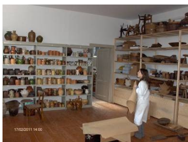
Prostori čuvaonica Muzeja