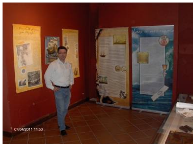
Po svjetskim morima u Dubrovniku