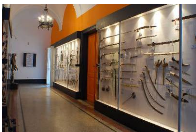
Studijski postav Zbirke starog oružja