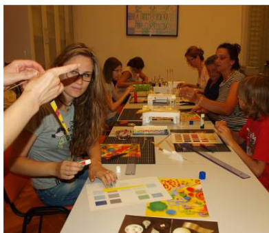
Radionica Nije zlato sve što sj