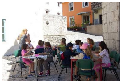
Muzejska stvaronica – Priča o Kastvu