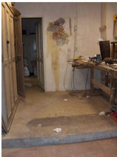
Prostor radionica Muzeja