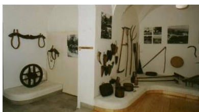
Dio stalnog postava – Etnografski odjel