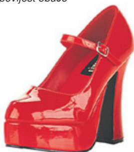
Poziv na izložbu Koje dobre šuze – rad akademske kiparice Milijane Babić