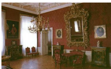
Dio stalnog postava – Kulturnopovijesni odjel