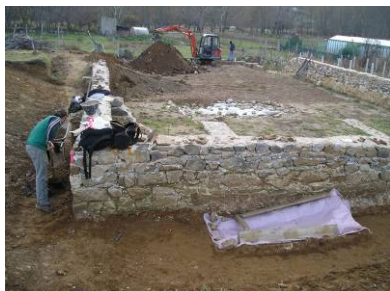
Arheološka istraživanja – Sv. Nikola, Jurandvor