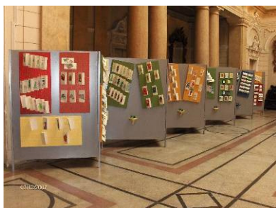
Prodajna izložba humanitarnog karaktera Božićna bajka