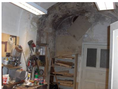
Oštećenja od vlage u prostoru radionica