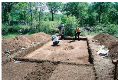
Arheološka istraživanja – Tribalj, Njivice