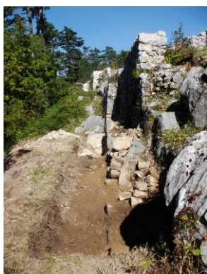
Arheološka istraživanja – Gradina, Klana