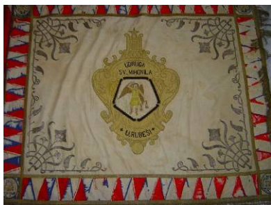
Zastava Sv. Mihovila