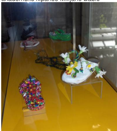
Učenički radovi s nagradnog natječaja Koje dobre šuze