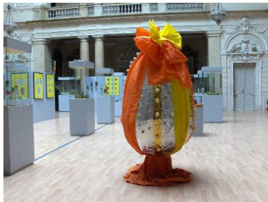
Izložba Uskrsna priča