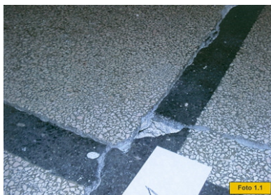
Pukotine u podu Atrija Muzeja