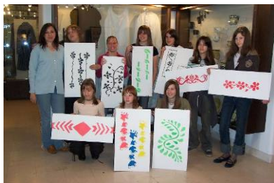
Radionica s djecom u Kastvu