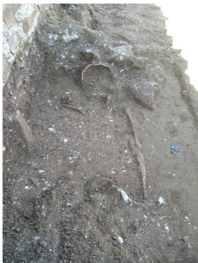
Grobni nalaz – Sv. Nikola, Jurandvor