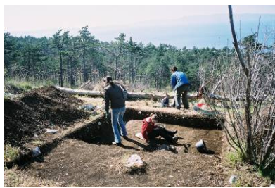
Arheološka istraživanja na gradini Solin, Kostrena