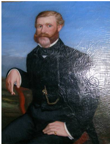
Kapetan Bonaventura Urpani