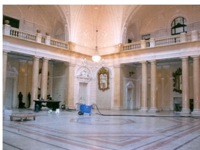
Radovi u Atriju Muzeja