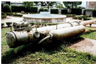
Lansirna cijev torpeda

Konzervatorsko – restauratorski postupci provedeni su na :