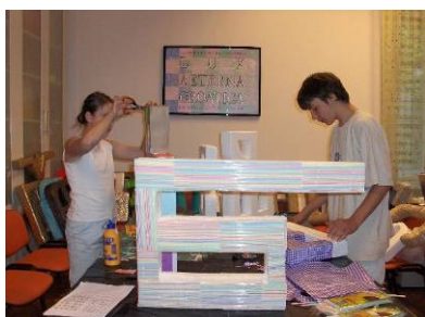
Radionica Učimo glagoljicu