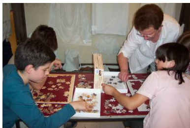
Izložba Složimo Kastav