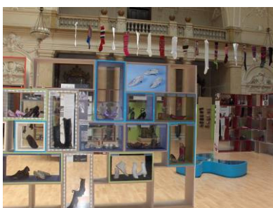
Izložba Koje dobre šuze – šetnja kroz povijest obuće