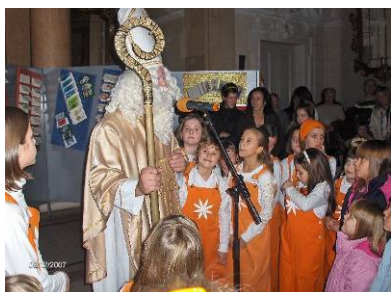
Sv. Nikola u Muzeju

Djelatnici Muzeja članovi su Društva povjesničara umjetnosti Rijeke, Istre i Hrvatskog primorja, Hrvatskog arheološkog društva, Hrvatskog muzejskog društva, Povijesnog društva Rijeke i Katedre čakavskog sabora Opatija. Intenzivna je suradnja s jedinicama lokalne samouprave na istraživanjima, sanaciji i prezentaciji materijalne i nematerijalne baštine.