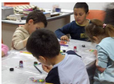
Radionica u Muzeju Uskrsna priča