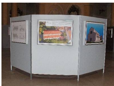
Izložba Ranokršćanska bazilika Sv. Marije Formoze u Puli