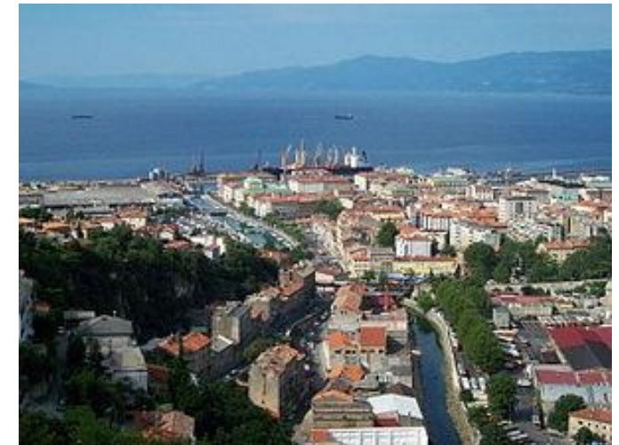
Grad Rijeka danas. / The City of Rijeka today.