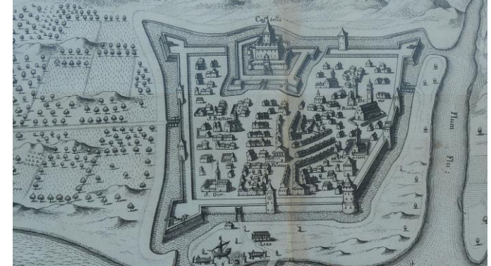
St. Weit am Flaum - Rijeka u prošlosti. / Rijeka in the past.