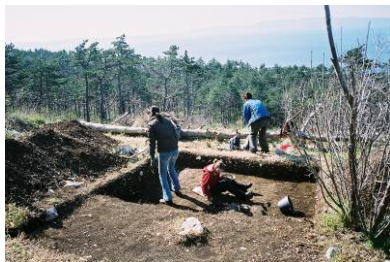
Solin - Kostrena