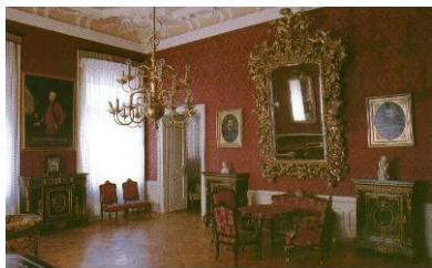
Dio stalnog postava – Kulturnopovijesni odjel